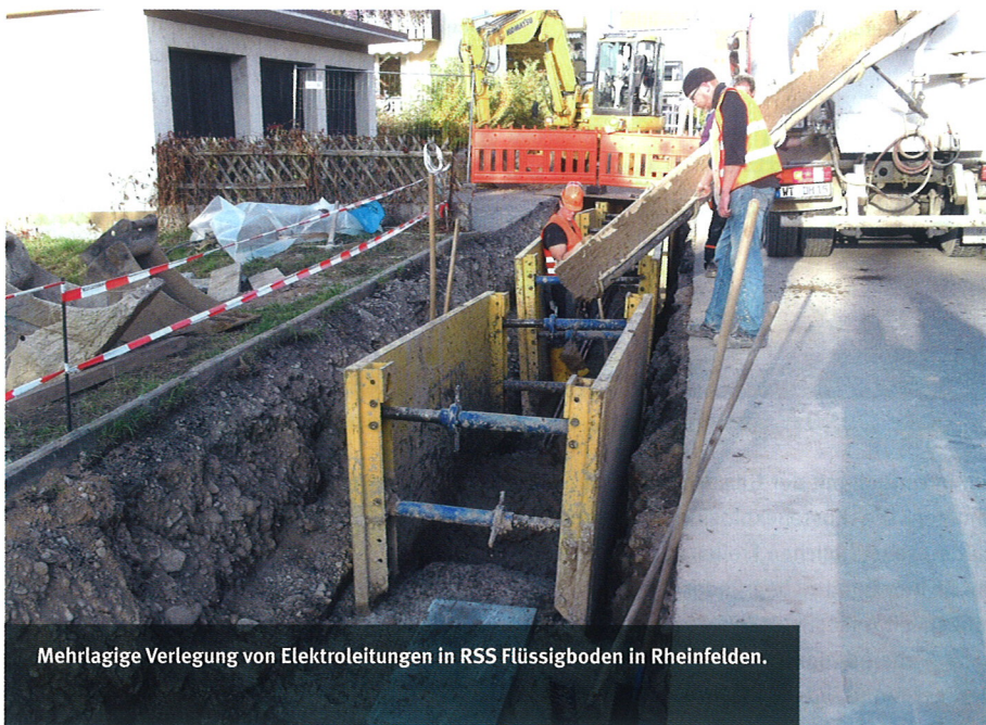
Mehrlagige Verlegung von Elektroleitungen in RSS Flüssigboden in Rheinfelden.

schützt. Dieses Fertigungsverfahren ermöglicht es, beliebige Arten von Bodenaushub, industriell hergestellte und natürliche Gesteinskörnungen, sowie andere mineralische Stoffe zeitweise fließfähig zu machen, selbstverdichtend wieder einzubauen und dabei bodenähn-