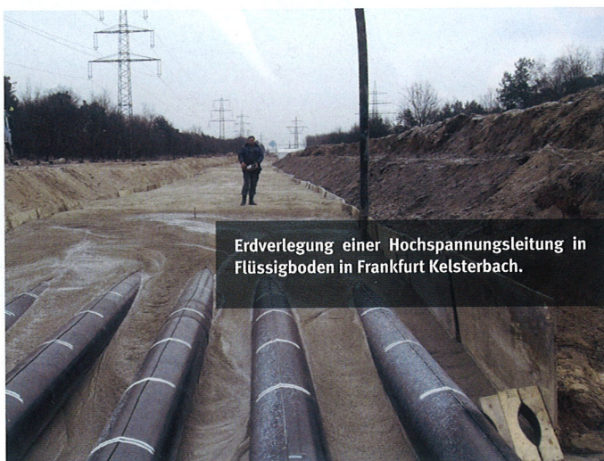
Erdverlegung einer Hochspannungsleitung in Flüssigboden in Frankfurt Kelsterbach.

RSS Flüssigboden (entsprechend RAL Gütezeichen 507) ist ein Gemisch aus dem Bodenaushub und Zusatzstoffen, sowie Wasser und einem Spezialkalk. Er ist das Ergebnis der Entwicklung des Flüssigbodenverfahrens. Dieses wurde ab 1998 durch das FiFB (Forschungsinstitut für Flüssigboden GmbH privatwirtschaftliches Unternehmen) in Leipzig entwickelt und in verschiedenen Varianten patentrechtlich ge-