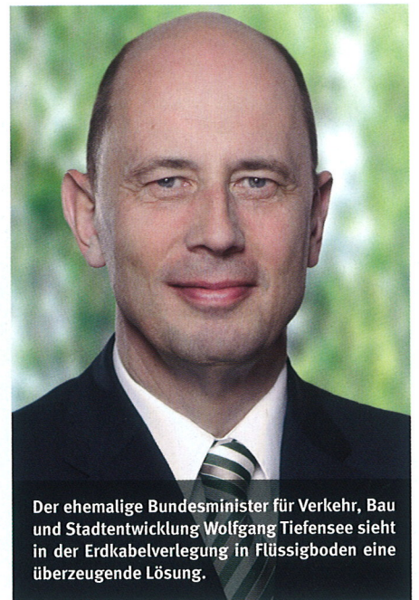
Der ehemalige Bundesminister für Verkehr, Bau und Stadtentwicklung Wolfgang Tiefensee sieht in der Erdkabelverlegung in Flüssigboden eine überzeugende Lösung.

Im Mai 2011 fand in Leipzig ein Treffen zwischen der Geschäftsleitung des FiFB und dem Bundestagsabgeordneter Wolfgang Tiefensee (SPD) statt. Der ehemalige Bundesminister für Verkehr, Bau und Stadtentwicklung sowie Beauftragter der Bundesregierung für die neuen Bundesländer, arbeitet heute u. a. im Bundestagsausschuss für Wirtschaft und Technologie. Er hat sich in den letzten Monaten intensiv mit der Leipziger Erfindung des Flüssigbodenverfahrens und seinen Anwendungsmöglichkeiten beschäftigt und kam im Oktober 2011 bei einem weiteren Gespräch zu dem Schluss,