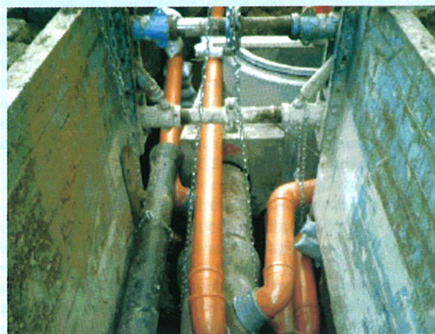
Rys. 1. Przykład sytuacji, w której gęstość sieci uniemożliwia poprawne wykonanie strefy zagęszczenia gruntu wokół przewodu w technologii tradycyjnej

Poczynając od średnicy 500 mm można zaobserwować istotne oszczędności szerokości wykopu, wynoszące dla tej średnicy oprawie 35%. Zmniejszenie szerokości wykopu jest bardzo istotne, nie-