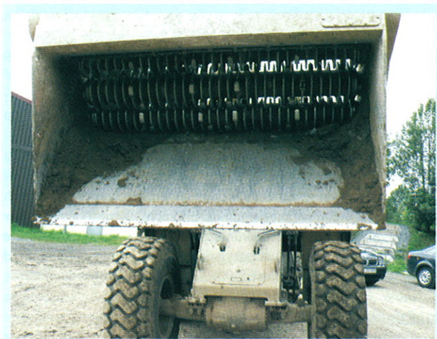
Rys. 2. Łyżka przesiewająco-krusząca z modułem dozującym

W celu ograniczenia uciążliwości dla środowiska i otoczenia, w szczególności pylenia oraz w celu uzyskania właściwych pa-