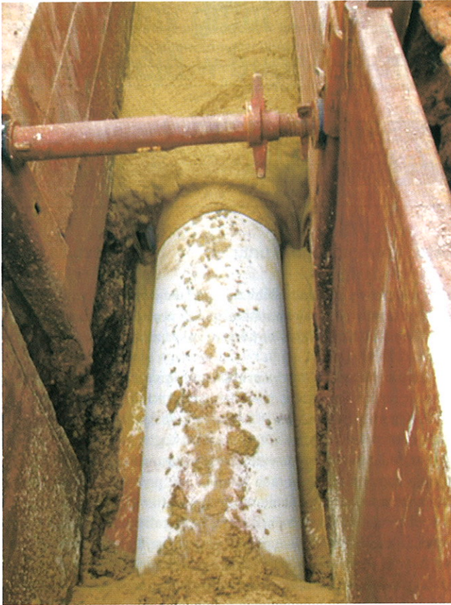
Rys. 3. Zalewanie przewodów czasowo upłynnionym gruntem wg technologii RSS-FB

rametrów materiału podstawowego, do przygotowania materiału podstawowego wykorzystuje się odpowiedni sprzęt w postaci łyżki przesiewająco-kruszącej z modułem dozującym. Wykorzystywane urządzenia muszą zapewniać wymaganą dokładność dozowania i gwarantować pełną dokumentację procesu. Przykład łyżki przesiewająco-kruszącej ważącej i dokumentującej proces dozowania materiałów pokazano na rys. 2.