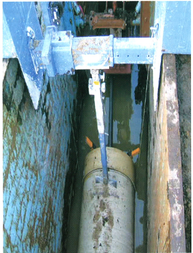
Rys. 4. Zastosowanie kompensatorów do przeciwdziałania wyporowi przewodów

Korzystne cechy technologiczne upłynnionego gruntu umożliwiają zdecydowane ograniczenie szerokości wykopów, zarówno w trak-